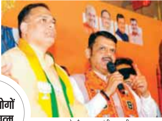
प्रचार के दौरान मुख्यमंत्री फडणवीस